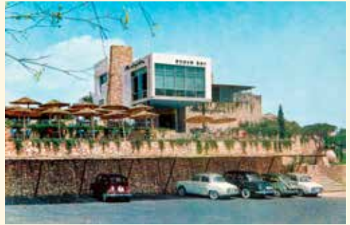
7. Postal de la Urbanización Campoamor, Snack-Bar "Montepiedra" . Foto: Guirao Fotocolor Valman, Barcelona, 1964 Colección Utopía