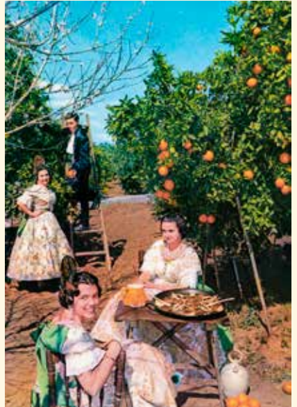
4. Postal De paella en un huerto de naranjos Ed. Durá, Valencia, 1964