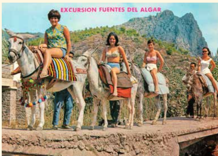
2. Postal de Callosa d'en Sarrià, Alicante. Excursión Fuentes Algar, 1968