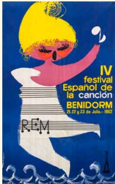
8. Cartel de Fermín Garbayo IV Festival Español de la Canción. Benidorm, 21, 22 y 23 julio 1962 Ed. Mateu Cromo, Madrid, 1962 Biblioteca Valenciana Nicolau Primitiu