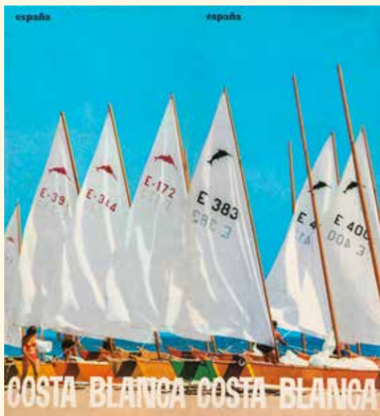
1. Folleto Costa Blanca . MIT, 1966 Biblioteca Valenciana Nicolau Primitiu. Fondo Lluís Guarner