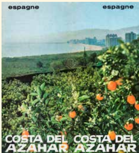
5. Folleto Costa del Azahar MIT, 1966 Biblioteca Valenciana Nicolau Primitiu