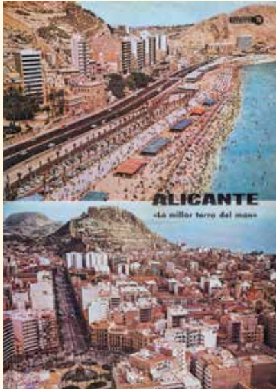
6. Cubierta de la revista Alicante turismo 70 (suplemento de Información. El periódico de Alicante ), 1970 Biblioteca Valenciana Nicolau Primitiu